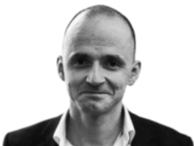
Олександр Лінчевський, Заступник міністра охорони здоров'я